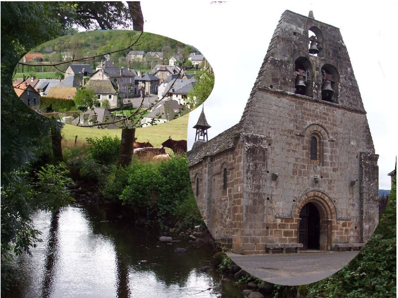
Photo choisie pour personnaliser des enveloppes à l'effigie de Vebret