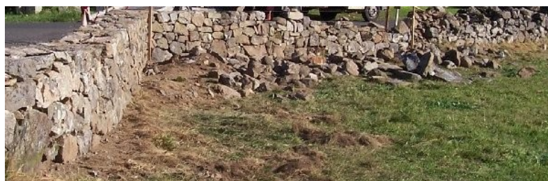
Le mur devant l'église en cours de réfection cet été.